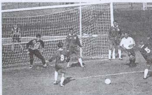
Бесхозный мяч в динамовской штрафной.

сто не видел момента удара, а потому не смог выручить. Оставшееся время «Динамо» провело в атаке, но желаемого не добились, гости открыто тянули время, но не брезговали острыми контратаками. Постнову дважды пришлось ликвидировать выходы один на один, и наш вратарь с блеском доказал, что это один из его «коньков».