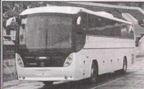
SCANIA G0L A3-5291