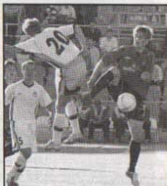
Никто не хотел уступать: очередная воздушная дуэль.